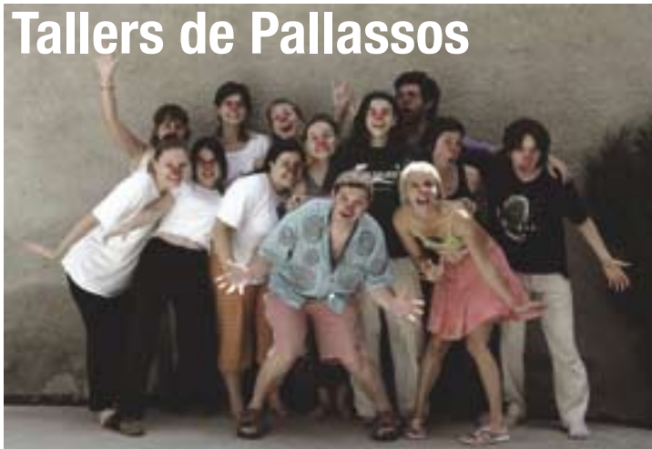
Grup de pallasos • 25 de juny